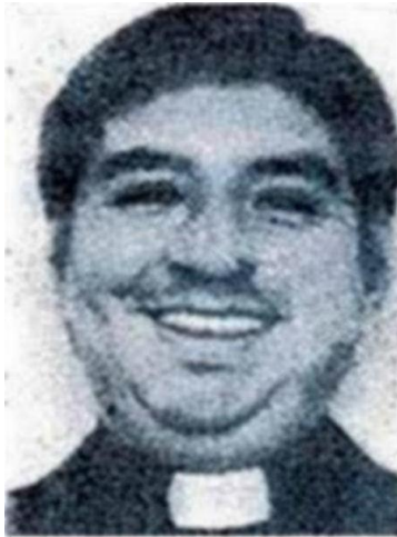
Fotografía tomada en 1991

Se dio a la fuga para evadir el proceso judicial – Actos lascivos e indecentes contra un menor de menos de 14 años